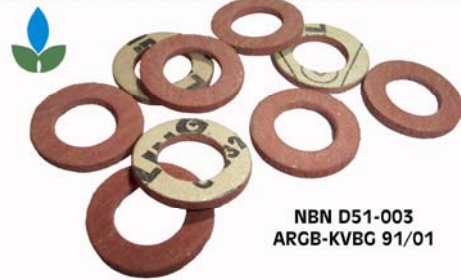
NBN D51-003 ARGB-KVBC 91/01

POUR CUISINIÈRE AVEC FILET CYLINDRIQUE - VOOR KOOKFORNUIS MET CILINDRISCHE DRAAD