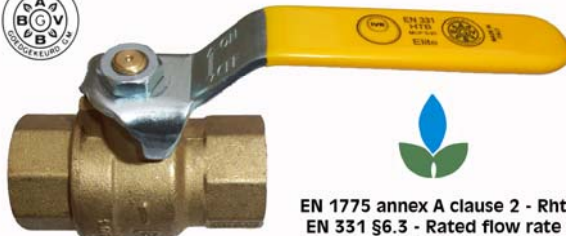
NBN D51-003 < 100 mbar

EN 1775 annex A clause 2 - Rht EN 331 §6.3 - Rated flow rate Report ARGB-KVBC 3152