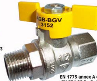
NBN D51-003 < 100 mbar

EN 1775 annex A clause 2 - Rht EN 331 §6.3 - Rated flow rate Report ARGB-KVBC 3152