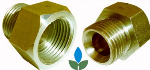
NBN D51-003 ARGB-KVBC 91/01 Raccord de transition - ISO228 - Overgangskoppeling INGAS ® INOX

POUR CUISINIÈRE AVEC FILET CYLINDRIQUE - VOOR KOOKFORNUIS MET CILINDRISCHE DRAAD