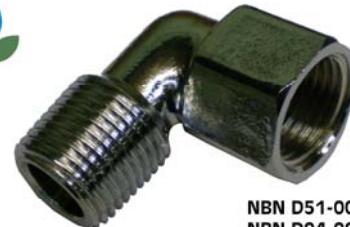
NBN D51-003 NBN D04-002 ARGB-KVBC

Coude 90° MF1/2" lalton nicketé - ISO 7 - Bocht 90° MF1/2" messing vernikkeld