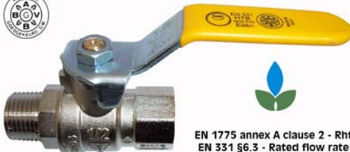
NBN D51-003 < 100 mbar

EN 1775 annex A clause 2 - Rht EN 331 §6.3 - Rated flow rate Report ARGB-KVBC 3152