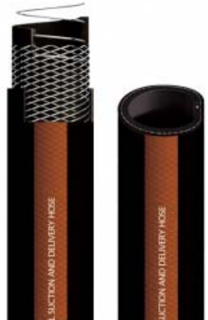
Dépression/ Vacuum 10 m H 2 O

For delivery and suction of mineral oils and crude fuels.